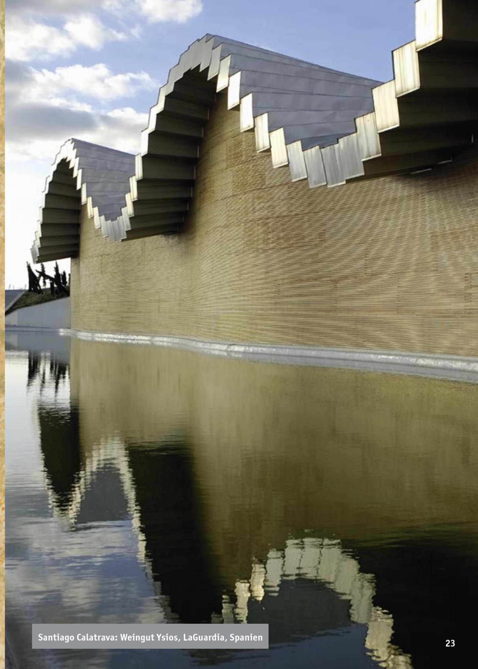
Santiago Calatrava: Weingut Ysios, LaGuardia, Spanien